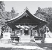
諏訪大社下社秋宮