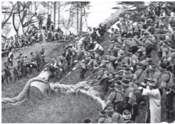
御柱祭 山出し「木落し」

諏訪大社では七年に一度、寅と申の年に宝殿の造営と、各社殿の四隅に巨木を曳き建てる神事を行います。これを「式年造営御柱大祭」、通称「御柱祭」と呼び、諏訪地方の6市町村21万人の氏子がこぞって参加する天下の大祭です。祭りでは、長さ約17m、直径約1m、重さ10tを超えるモミの大大木を山から切り出し、人力のみで道中を曳き、最後に各社殿を囲むように四隅に建てます。柱を山から里へと曳き出す「山出し」が4月に、境内までの道中を曳き、御柱を各社殿の四隅に建てる「里曳き」が5月に、4社それぞれで行われます。