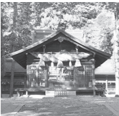
諏訪大社下社春宮

諏訪大社は「上社」と「下社」に分かれ上・下社各2社、計4社あります。ここ下諏訪町には、下社である「秋宮」と「春宮」があります。